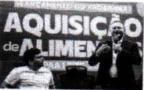
Nesta primeira etapa do programa serão beneficiadas mais de 10.500 famílias.

Além do lançamento do programa e da assinatura do Termo de Adesão ao PAA Leite entre o Governo do Maranhão e a Prefeitura, foram discutidas as capacidades aos agentes público municipais para operacionalizar o programa no município.