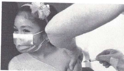
ESQUEMA DE VACINAÇÃO DEVE SER DE DUAS DOSES COM INTERVALO DE 28 DIAS

A aprovação da CoronaVac para parte da população pediátrica ocorreu após avaliação das áreas técnicas da agência. Depois da análise, a Gerência-Geral de Medicamentos e Pro-