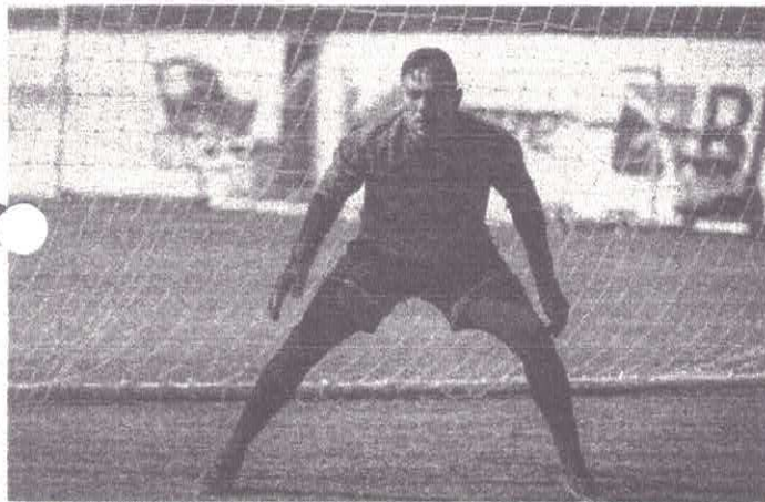
Diego Alves no treino desta terça, no Ninho do Urubu