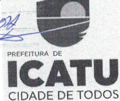
FIG. Nº 173 Proc. Nº 907/2022

CNPJ: 05.296.298/0001-42 Rua Coronel Cortez Maciel, s/n. Centro, Icatu – MA