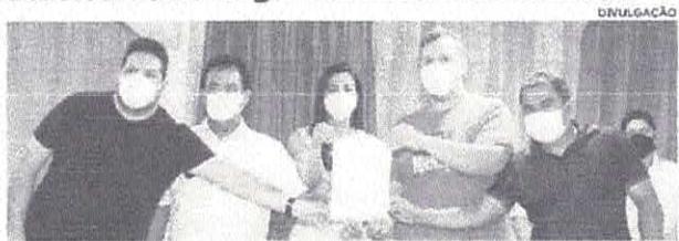
A deputada Daniella escreve a ordem de serviço para construção de mais obras em Presidente Dutra

O município de Presidente Dutra ganhará uma casa de cultura e um sistema simplificado de abastecimento d'água viabilizados com emenda parlamentar da deputada Daniella (DEM). A ordem de serviço foi assinada na segunda-feira (31), na sede da Prefeitura de Presidente Dutra. Na ocasião, além da deputada, estavam presentes o prefeito Raimundinho da Audiência e membros do Governo do Estado. A criação de uma casa de cultura no município foi proposta pelo vereador Franklin Torres, que apresentou a demanda por meio de Indicação à deputada Daniella. A partir daí, os dois viabilizaram a construção do espaço, o que ocorrerá por meio de parceria entre a Secretaria de Estado da Educação (Secuc-MA) e a Secretaria de Estado da Cultura e Turismo (Secur). A Casa de Cultura será um espaço destinado ao incentivo à cultura e à educação, com