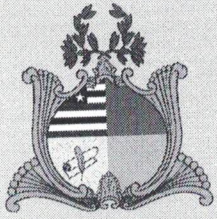
FIG. Nº 139 Proc. Nº 1015/2022 Rótulo Nº 2

ESTADO DO MARANHÃO PREFEITURA MUNICIPAL DE ICATU